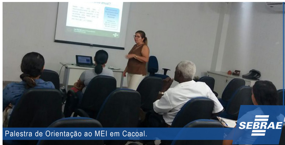
Palestra de Orientação ao MEI em Cacoal.