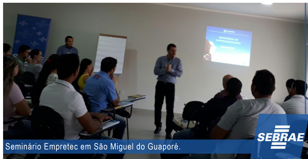
Seminário Empretec em São Miguel do Guaporé.