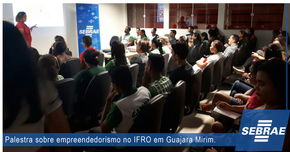
Palestra sobre empreendedorismo no IFRO em Guajara Mirim.