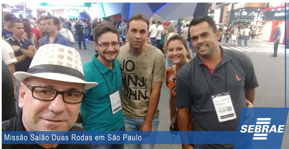
Missão Salão Duas Rodas em São Paulo