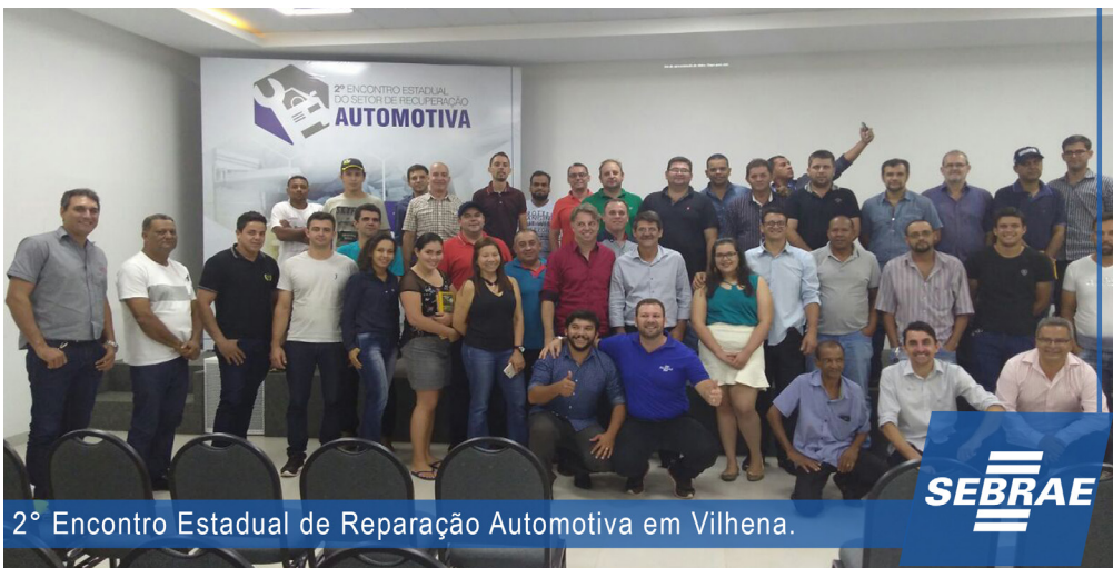
2º Encontro Estadual de Reparação Automotiva em Vilhena.