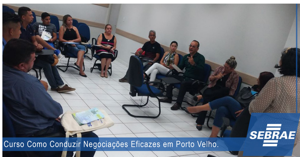
Curso Como Conduzir Negociações Eficazes em Porto Velho.